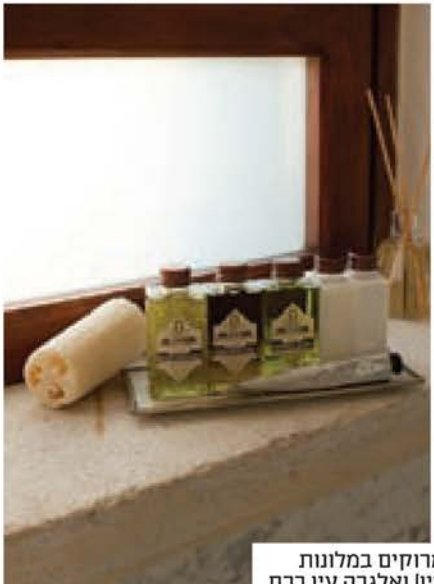
הגשה אלגנטית לתמרוקים במלונות הבוטיק ורסאנו (מימין) ואלגרה עין כרם