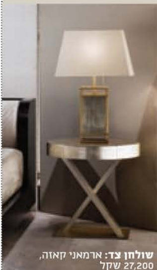
שולחן צד: ארמאני קאזה, שקל 27,200

לפני כעשור נכנסה לתודעה הכותנה המצרית, ותשומת הלב נפתחה מצפיפות האריגה לחוט שבו אורגים. ככל שסיבי הכותנה ארוכים ודקים יותר, כך ניתן ליצור בעזרתם חוטים חזקים, גמישים ורכים יותר. סיבי הכותנה המצרית הם הסיבים הארוכים, הדקים והחזקים ביותר בעולם. אם תכניסו מצעים מכותנה מצרית למיבש, המסנן שלו יהיה נקי לגמרי, ללא המוך שתמיד מצטבר בו. בקיצור, המצעים האלה אמורים להחזיק עשורים שלמים, ומובטח לכם שישארו רכים ואיכותיים במשך כל הזמן שהם משרתים אתכם.