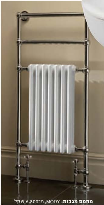
מחמם מגבות: MODY, מ-6,800 שקל