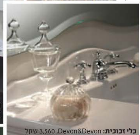
כלי זכוכית: Devon&Devon, 3,560 שקל