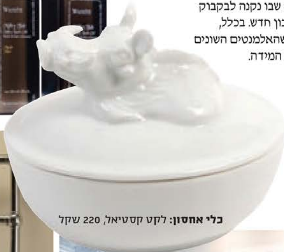
כלי אחסון: לקט קסטיאל, 220 שקל

זה הפינוק האולטימטיבי לחורף, למי שיכול להרשות לעצמו: מתלה מגבות המשלב גוף חימום, כך שהמגבות מתחממות בזמן שאנחנו מתקלחים.