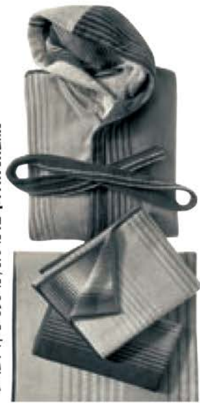
מגבות וחלוקים: מיסוני, מ-850 שקל לפריט