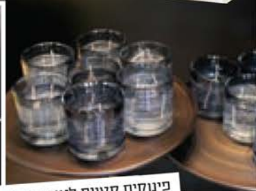
פינוקים קטנים לאורחים: נרות ריחניים וסוכריות באריזה אישית