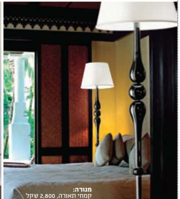
מנורה: קמחי תאורה, שקל 2,800