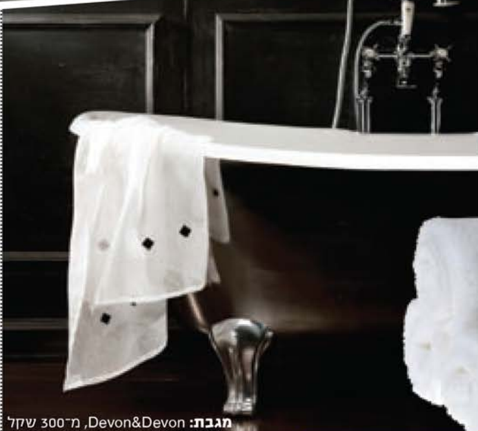
מגבת: Devon&Devon, מ-300 שקל