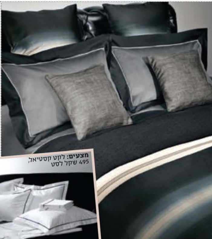
מצעים: לקט קסטיאל, שקל 495