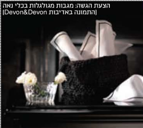
הצעת הגשה: מגבות מגולגלות בכלי נאה