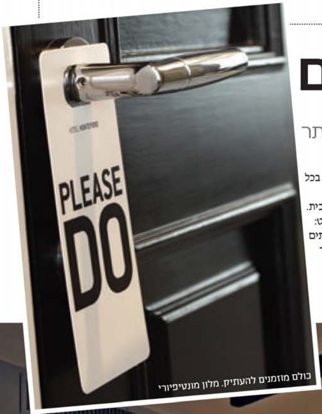
בולם מזומנים להעתיק. מלון מונטיפיורי

מעצבת הפנים אליון לנגליב מגלה לך את סודות המקצוע